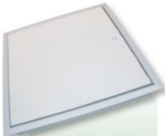
FHK-EI 30, saranoitu, kipsilevyllä päällystetty kansi