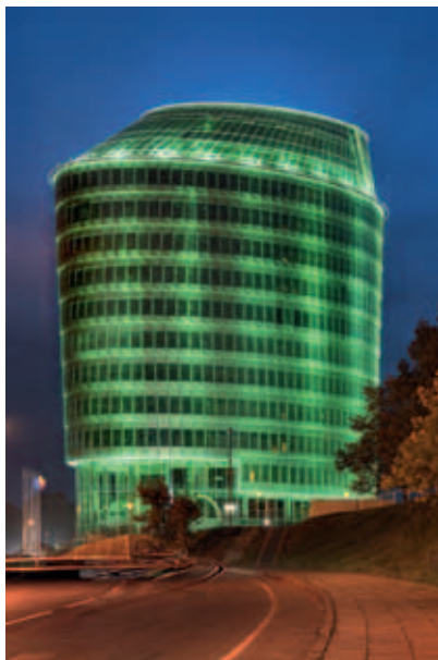
Green Hall-toimistotalo, Vilna; julkisivuprofiilien jauhemaalaus