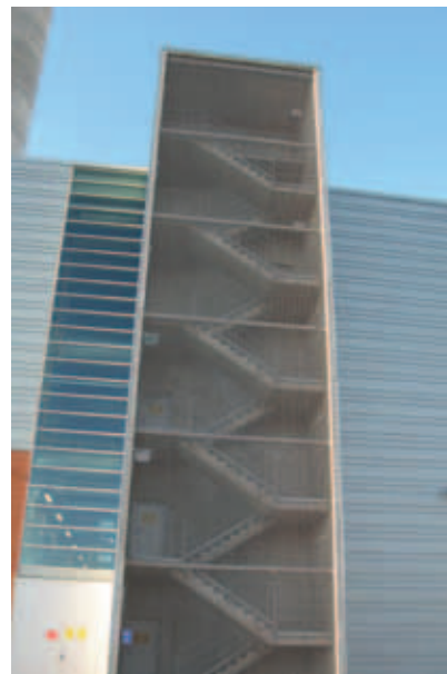
Hanasaaren varavoimalaitos, Helsinki; sisäkatot ja GKD-julkisivuverkot