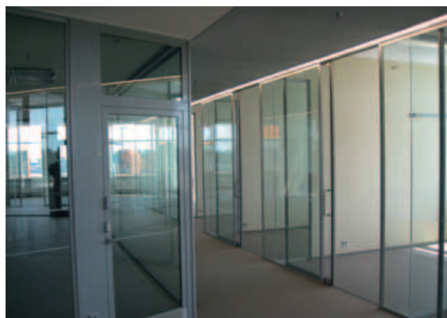
Pauligin kahvipaahtimo, Helsinki; sisäkatot, järjestelmäseinät, äänenvaimennusruihkutukset ja valaisinkartiot