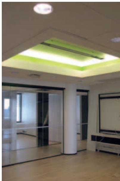
Kiinteistö Oy Lintulahdenvuori, Helsinki; sisäkatot, järjestelmäseinät, pysäköintitilan seinäpellitykset ja lämmöneristykset