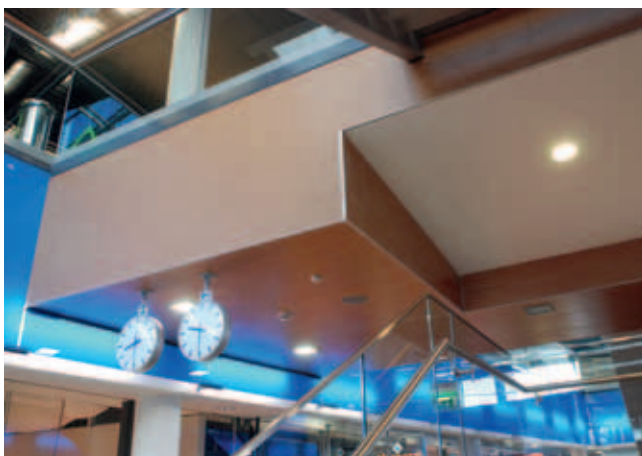
PGR Kauppakeskus, Tornio; sisäkatot ja väliseinät