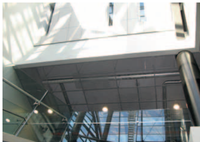
Gatehouse, Helsinki; sisäkatot ja akustiset verhoukset