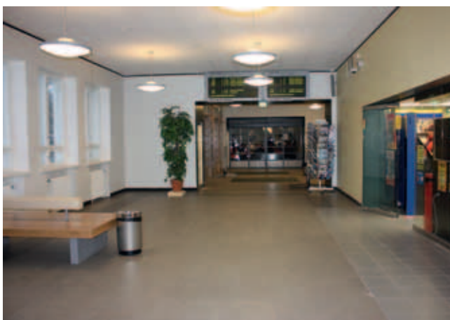
Rautatieasema, Riihimäki; kokonaissisustustyöt