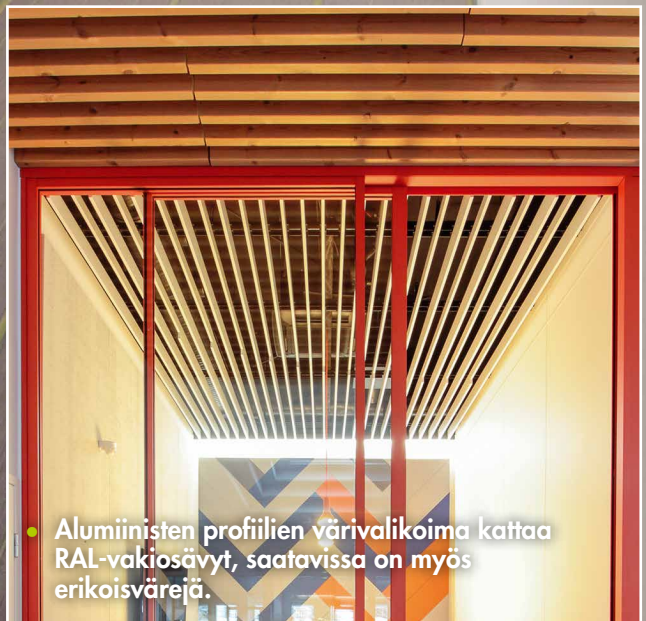
• Alumiinisten profiilien värivalikoima kattaa RAL-vakiosävyt, saatavissa on myös erikoisvärejä.