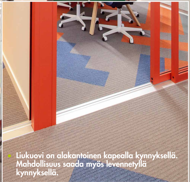
• Liukuovi on alakantoinen kapealla kynnyksellä. Mahdollisuus saada myös levennetyllä kynnyksellä.