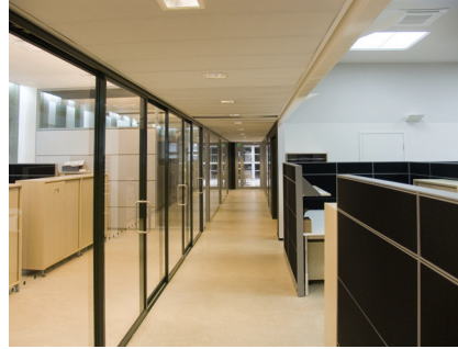
Konsernipalveluiden toimistotilojen saneeraus toteutettiin vuodenvaihteen jälkeen. Kuvassa pääkätäväkuvaa takaoven sisäänkäynnin suunnasta katsottuna.

Herttoniemen pääkonttorin remonitin kakkosvaihe saatiin päätökseen. Miellyttävän ja toimivan työympäristön lisäksi uudet tilat muodostavat loistavan näyteikkunan uusimpien sisäkatto- ja järjestelmäseinätuotteiden esittelyyn.